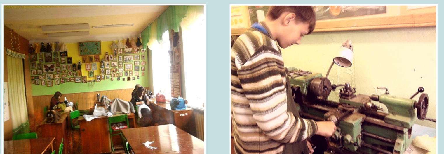
МАЙСТЕРНЯ ОБСЛУГОВУЮЧОЇ ПРАЦІ