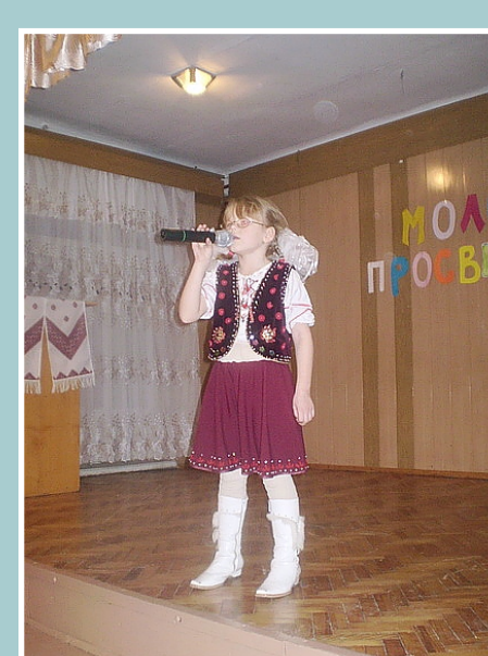
УЧАСНИЦЯ ВОКАЛЬНОЇ СТУДІЇ

УРОК-МУЗИЧНА ВІКТОРИНА; УРОК-ЛЕКЦІЯ; УРОК-КОНКУРС; УРОК-ОПЕРА; КОМБІНОВАНІ УРОКИ; ІНТЕГРОВАНІ УРОКИ; УРОК-КОНЦЕРТ