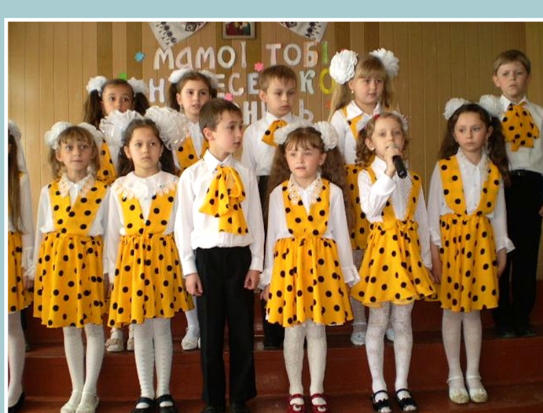
ЮНІ ТАЛАНТИ АНСАМБЛЮ “ПОСМІШКА”

ІСТОРИЧНО-МИСТЕЦЬКІ АЛЬМАНАХИ; КОНЦЕРТНІ ПРОГРАМИ; УРОЧИСТІ ЛІНІЙКИ; ЮВІЛЕЇ ШКОЛИ; КВК; СЕМІНАРИ; ТЕМАТИЧНІ РАНКИ; КОНКУРСНІ ПРОГРАМИ; ЛІТЕРАТУРНО-МУЗИЧНІ КОМПОЗИЦІЇ