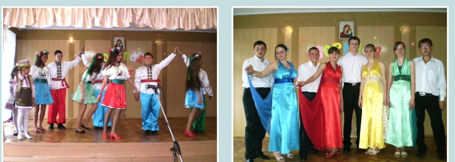
ВИСТУП УЧНІВ У КОСТЮМАХ ВЛАСНОГО ВИРОБНИЦТВА