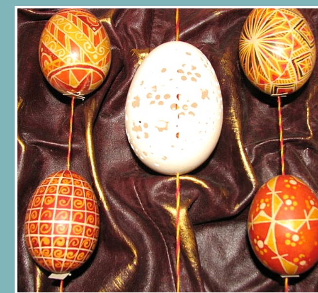
НА ВИСТАВЦІ МАРІЇ СУП

2006-2010 РР. - УЧАСНИК ЗБІРНИХ ВИСТАВОК ТВОРЧОГО ОБ'ЄДНАННЯ “КАКТУС” 2009 Р. - УЧАСНИК ВИСТАВКИ “РІЗДВЯНІ ДАРИ” 2009 Р. - ПЕРСОНАЛЬНА ВИСТАВКА В АРТ-ГАЛЕРЕЇ ТЕРНОПОЛЯ 2009 Р. - ПЕРСОНАЛЬНА ВИСТАВКА, ГАЛЕРЕЯ “МИСТЕЦЬКА РАМАРНЯ” 2010 Р. - УЧАСНИК ВИСТАВКИ “АНГЕЛИ СЕРЕД НАС”, ГАЛЕРЕЯ “СЛИВКА”.