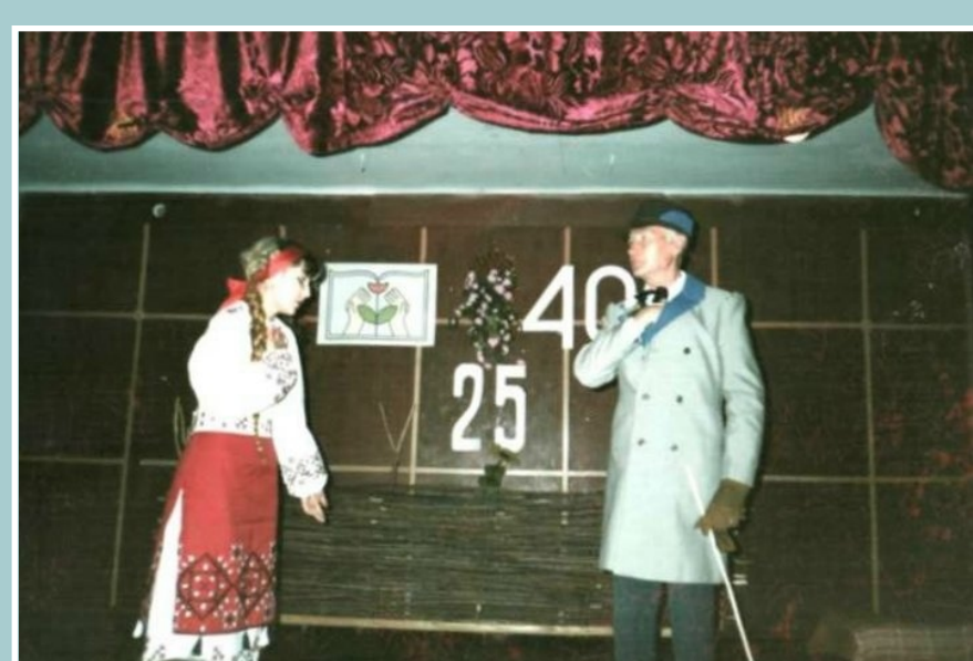
УРИВОК З ВИСТАВИ “НАТАЛКА-ПОЛТАВКА”

ІСТОРИЧНО-МИСТЕЦЬКІ АЛЬМАНАХИ; КОНЦЕРТНІ ПРОГРАМИ; УРОЧИСТІ ЛІНІЙКИ; ЮВІЛЕЇ ШКОЛИ; КВК; СЕМІНАРИ; ТЕМАТИЧНІ РАНКИ; КОНКУРСНІ ПРОГРАМИ; ЛІТЕРАТУРНО-МУЗИЧНІ КОМПОЗИЦІЇ