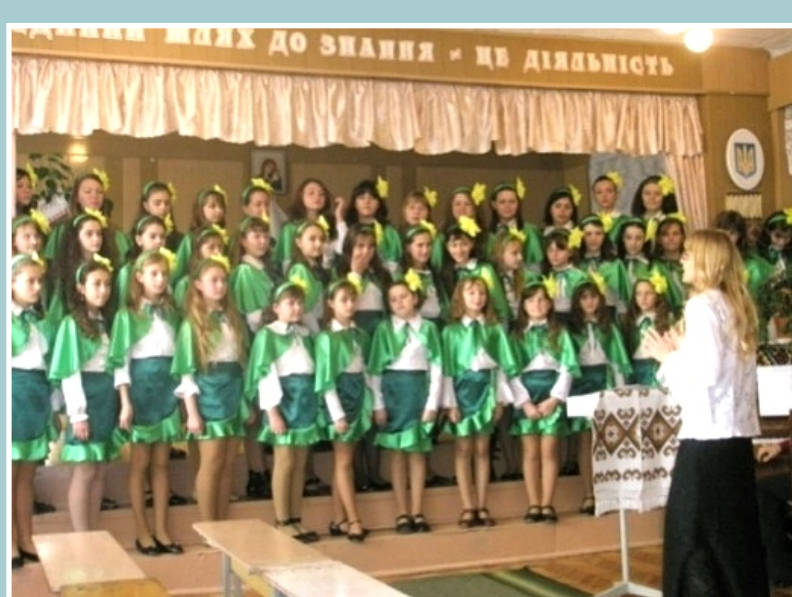
ШКІЛЬНИЙ ХОР “ПЕРВОЦВІТ”